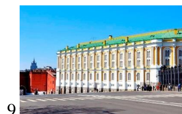
Таблица к заданию Архитектурные памятники Московского Кремля